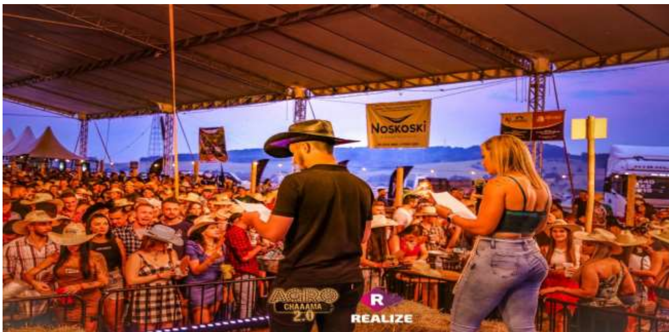
PARTICIPAÇÃO NA ITAIPU RURAL SHOW EM PINHALZINHO