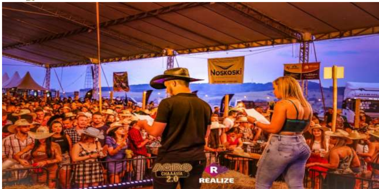
PARTICIPAÇÃO NA ITAIPU RURAL SHOW EM PINHALZINHO